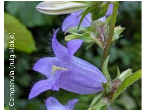
Campanula (ruig klokje)

ten over de acties van Groene Loper Zwolle? Kijk dan op groeneloperzwolle.nl en/of geef je op voor de nieuwsbrief via info@groeneloperzwolle.nl