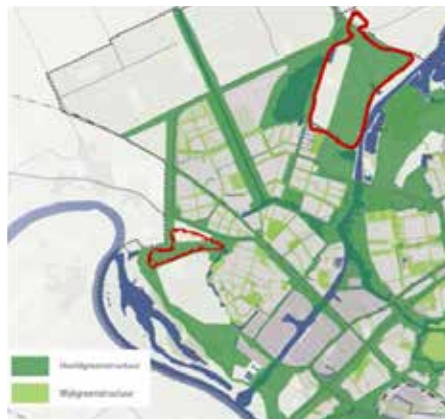
Stadsbroek en IJsselvizier

atie. Er is nu geen integraal overzicht van natuur en biodiversiteit. Niet voor behoud, niet voor versterking. Europese kaders - zoals 30% van het land- en wateroppervlak reserveren voor natuur - ontbreken. In 2017 had Zwolle slechts 3,7% natuur volgens CBS-cijfers.