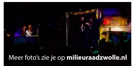
Meer foto's zie je op milieuraadzwolle.nl