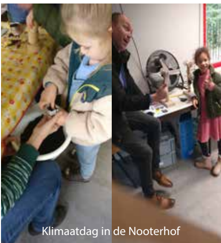
Klimaatdag in de Nooterhof

IVN Zwolle, Milieuraad Zwolle en Zwolse energiecoaches verzorgden enkele activiteiten in de Nooterhof op klimaatdag, 4 november. Een er van is een verpakkingsprijsvraag, die we nu herhalen voor de lezers van de Milieupraat.