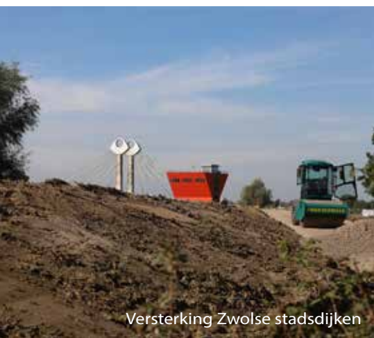
Versterking Zwolse stadsdijken

Behalve voor de flora zijn de dijken belangrijk voor veel soorten insecten. Onderzoek heeft aangetoond dat er een belangrijke relatie bestaat tussen de beschermde Kievitsbloem en de zanddijken. In de zanddijken nestelen graafbijen en wespen die zorgen voor bestuiving van de Kievitsbloem.