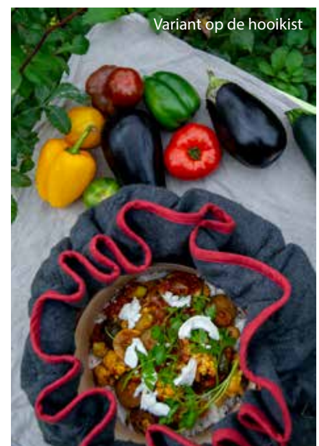
Variant op de hooikist

Kies je toch een slowcooker dan kun je de meest duurzame kiezen: duurzaamthuis.nl geeft een vergelijking.