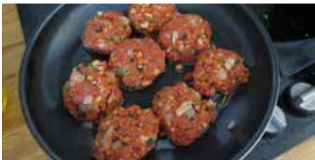
Tekst en foto: Loes la Faille

Informatie en aanmelden zwolle.nl/tegelwippen