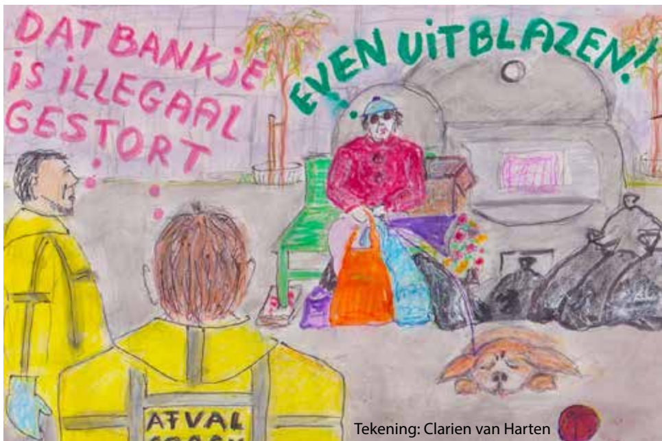
Tekening: Clarien van Harten

info@milieuraadzwolle.nl www.milieuraadzwolle.nl