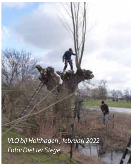
VLO bij Holthagen, februari 2022

Extra ondersteuning door de gemeente is hard nodig, want in 2021 hadden had nog maar 1 op 3 koophuizen energielabel A of B. Die extra steun is ook nodig voor scholen, wijkcentra, sportvoorzieningen en ander maatschappelijk vastgoed waarvoor de gemeente verantwoordelijk is.