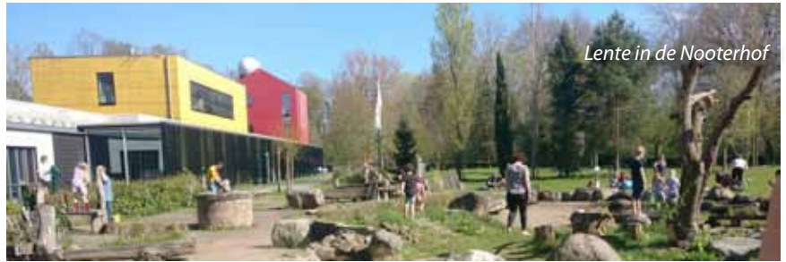
Lente in de Nooterhof