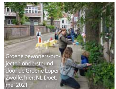
Groene bewoners-projecten ondersteund door de Groene Loper Zwolle, hier: NL Doet, mei 2021

Ben je nieuwsgierig naar de activiteiten die er in Zwolle plaatsvinden tijdens Burendag? Neem dan een kijkje op burendag.nl/mijn-buurt