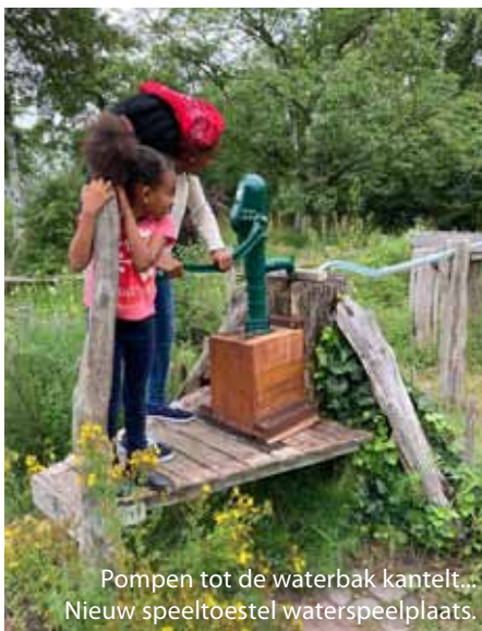
Pompen tot de waterbak kantelt... Nieuw speeltoestel waterspeelplaats.