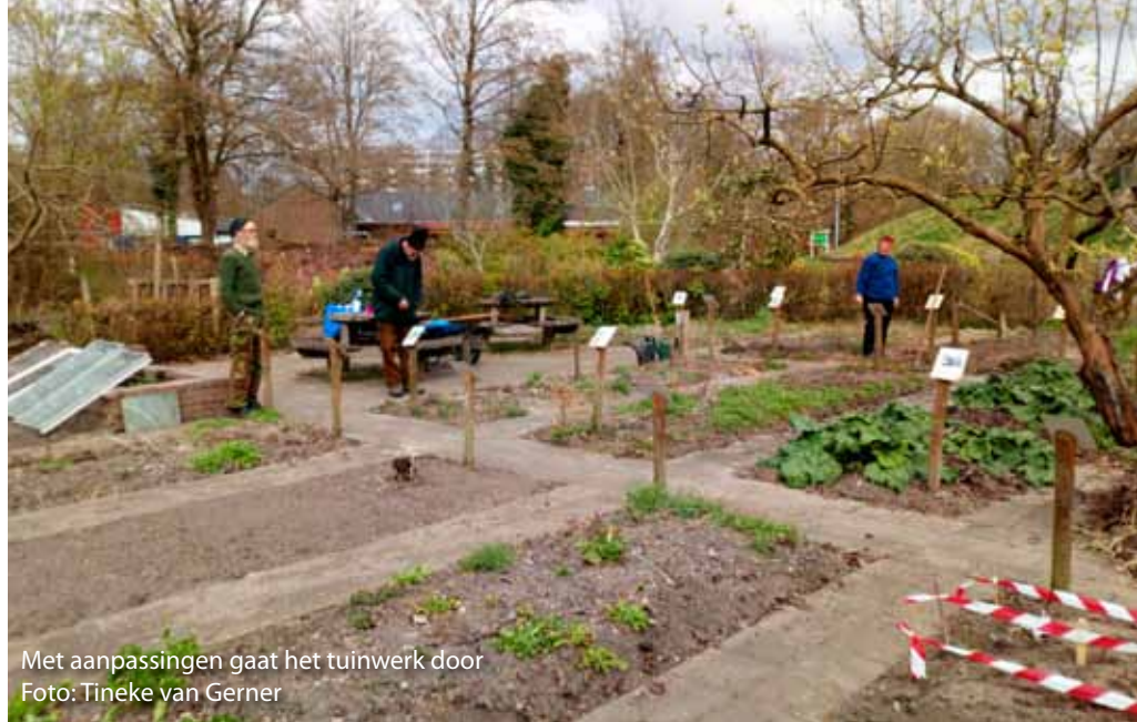
Met aanpassingen gaat het tuinwerk door