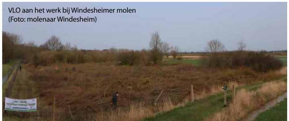
VLO aan het werk bij Windesheimer molen

De VLO knotte de eerste week van januari 2020 achter Soeslo. Een gebied waar prachtige rijen populieren en wilgen staan die al vele jaren door de VLO worden geknot. De oliebolle smaakten goed, het vuurtje knapperde en de reeën kwamen ook nog even kijken. Eigenlijk zou er nog een week gewerkt worden, maar dankzij de grote groep knotters (38) was het werk al snel klaar. De rest van januari was het lekker knotten in de landerijen aan de Nilantweg. In februari werden een paar rijen wilgen in de omgeving van de Schelberger molen geknot. De week erop werd op twee plaatsen geknot, op het erf aan het begin van de Aalvangersweg en op een erf aan de Kattenwinkelweg. Het griend bij de Windesheimer molen was drie weken lang het terrein voor de knotters. Het was heerlijk toeven bij de molen, soms met wel heel harde wind, maar toch ook nog wel in het zonnetje gezeten met de koffie en soep. Zelfs de wielrenners van de 'Ster van Zwolle' kwamen nog even langs. En de wieken van de molen draaiden volop! De afsluiting van het knotseizoen was in de Nooterhof met allerlei snoei-, knot en herstelwerk.