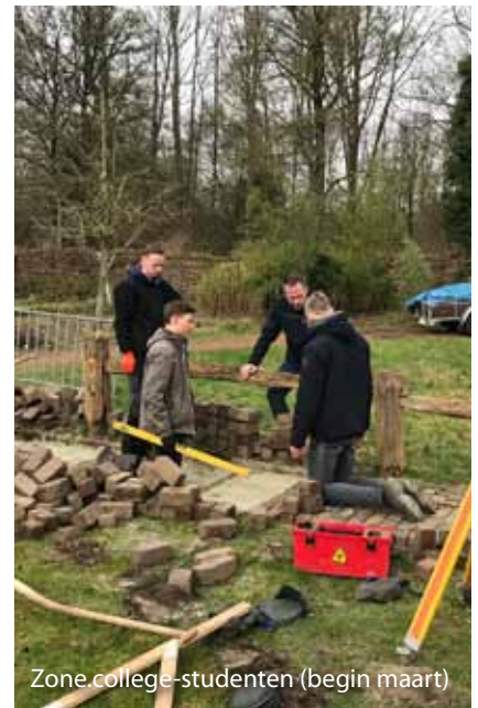
Zone.college-studenten (begin maart)

Als de bezoekers weer toegelaten kunnen worden, zullen ze toch mooie voorde- ringen kunnen zien in het grote park onderhoud, en in de tuinen. Ook wordt de service in het Earthship verder uitgebreid.