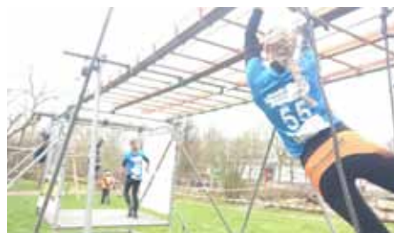
Op 9 februari was de Nooterhof gastvrij voor de Thorrun.

We zijn hard aan de slag om dit het komende seizoen nog beter waar te maken. Nieuwe vrijwilligers blijven heel welkom bij alle Nooterhof-activiteiten. Help jij mee werven? Belangstellenden kunnen mailen naar kantoor@milieuraadzwolle.nl