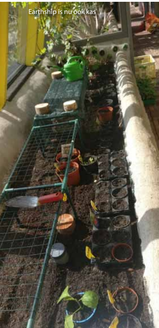
Earthship is nu ook kas

In de wintertijd kwam een deel van de vrijwilligers van de tuinen in het Earthship bijeen voor een bakkie en gezellige koffiepauze. Ook werd elke keer wat theorie van ecologisch tuinieren (VELT-methode) besproken. Over 6-jarige wisselteelt – elk jaar wisselen de groentebedden van gewasgroep. Over de grond, bodemleven, compostering en mulchen. De derde keer ging het over grondbewerking en zaaien. Op 4 maart is het tuinseizoen gestart. In een zacht voorjaarszonnetje zijn de eerste werkzaamheden verricht. Er is gestart met het opzetten van het groene kasje in de hoek van de picknicktafels. In dit kasje worden gewassen voorgezaaid om deze later als plantjes in de groentevakken of bedden te planten. Ook worden dit jaar in het Earthship, aan de kant van de toiletten, plantjes opgekweekt die extra warmte nodig hebben. Later zullen we hier ook planten laten groeien zoals tomaten- en paprikaplanten. En er is een zogenaamde koude bak gemaakt. Hierin kunnen ook groenten worden voorgezaaid. In de koude bak is de temperatuur hoger en worden de jonge plantjes beschermd tegen nachtvorst, mocht die nog komen. Sinds half maart wordt er gewerkt met heel weinig mensen tegelijk, vanwege de regels rond het coronavirus. Toch lukt het om het tuinonderhoud op koers te houden.