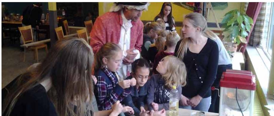
Plantinzicht! Een NME project van de Milieuraad

De Milieuraad organiseert zelf onder andere het Voor- en Nazomerfeest en om het jaar het zogenaamde scholen project. Tijdens deze evenementen is naast de Natuur- en Milieueducatie het entertainment ook een onderdeel. De Milieuraad hoopt dat door NME de kennis over natuur en duurzaamheid groter wordt, zodat men bewuste keuzes op dit gebied kan maken. Verder is het belangrijk dat de schoonheid van de natuur getoond wordt, zodat mensen zich daarover gaan verwonderen en daarom respectvol met hun leefomgeving om willen gaan. Het zou mooi zijn, wanneer NME ook bij de buitenschoolse opvang en in het middelbaar onderwijs structureel aan de orde zou komen.