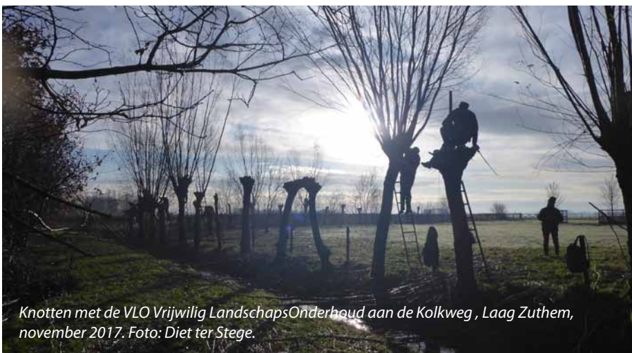
Knotten met de VLO Vrijwillig LandschapsOnderhoud aan de Kolkweg, Laag Zuthem, november 2017.

Hoewel alle insecten koudbloedig zijn, zijn ze hotter dan ooit. In aantal gaan ze enorm achteruit. We vinden ze overal om ons heen, soms mooi, soms lastig, maar over het algemeen nuttig. De moeite waard om deze complexe wereld van ongewervelde zespotters te bestuderen. Er zijn 5 cursusavonden op vrijdag met aansluitend op zaterdagochtend een excursie.